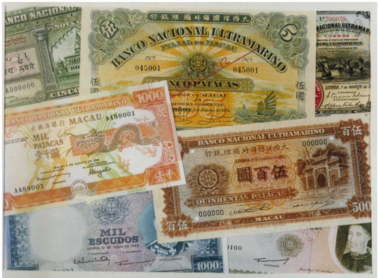
Papel moeda do BNU