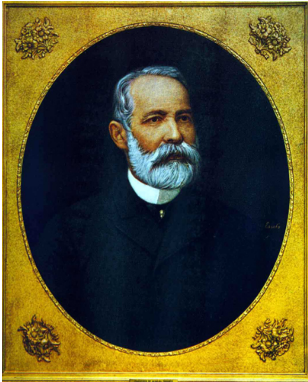
Francisco de Oliveira Chamiço