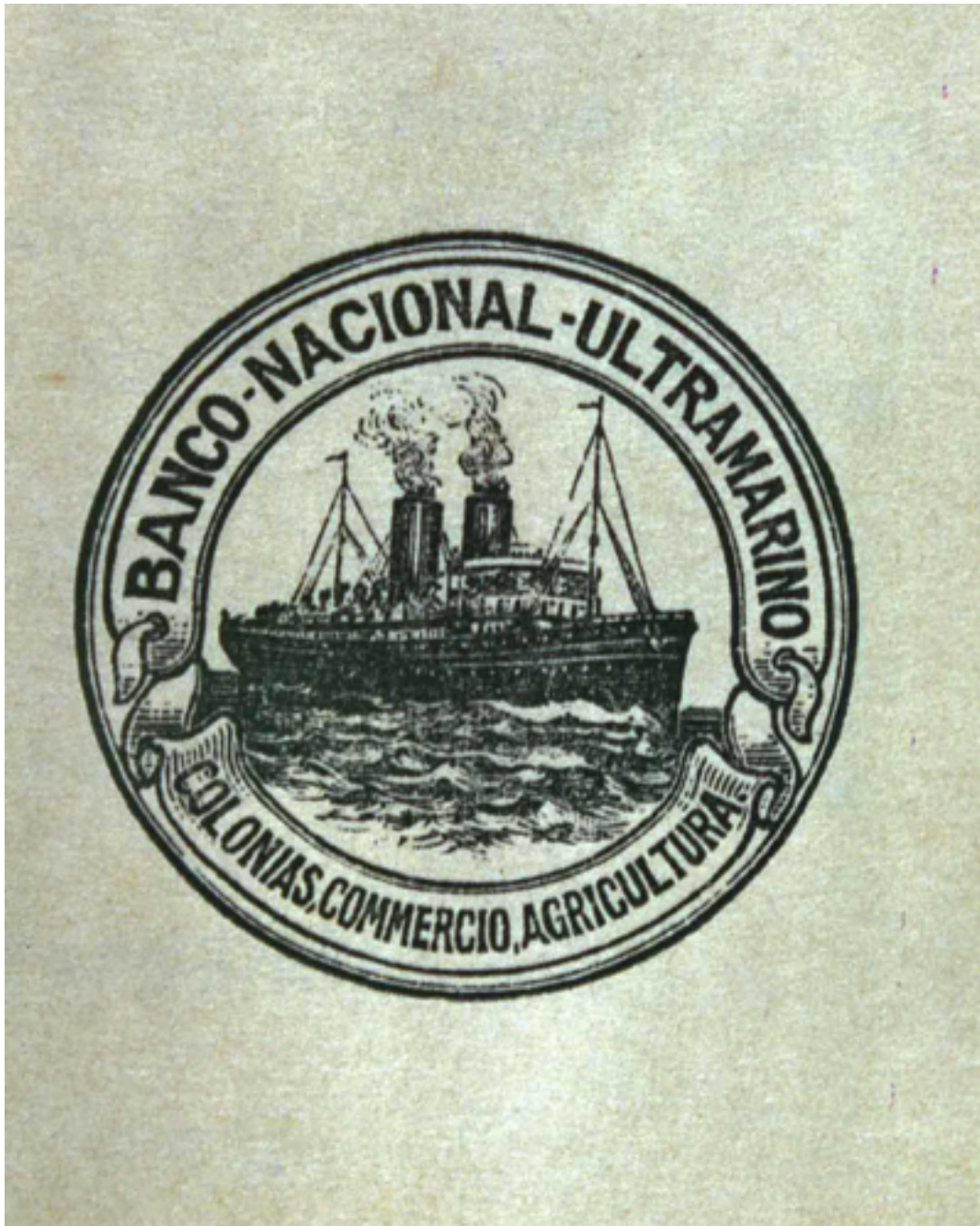
Selo do Banco