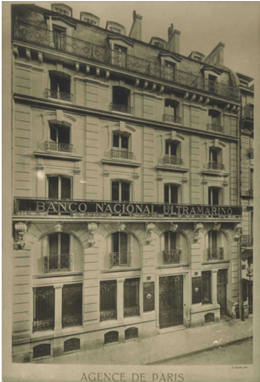
Agência em Paris