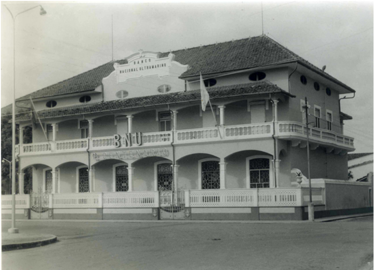
S. Tomé (1868)