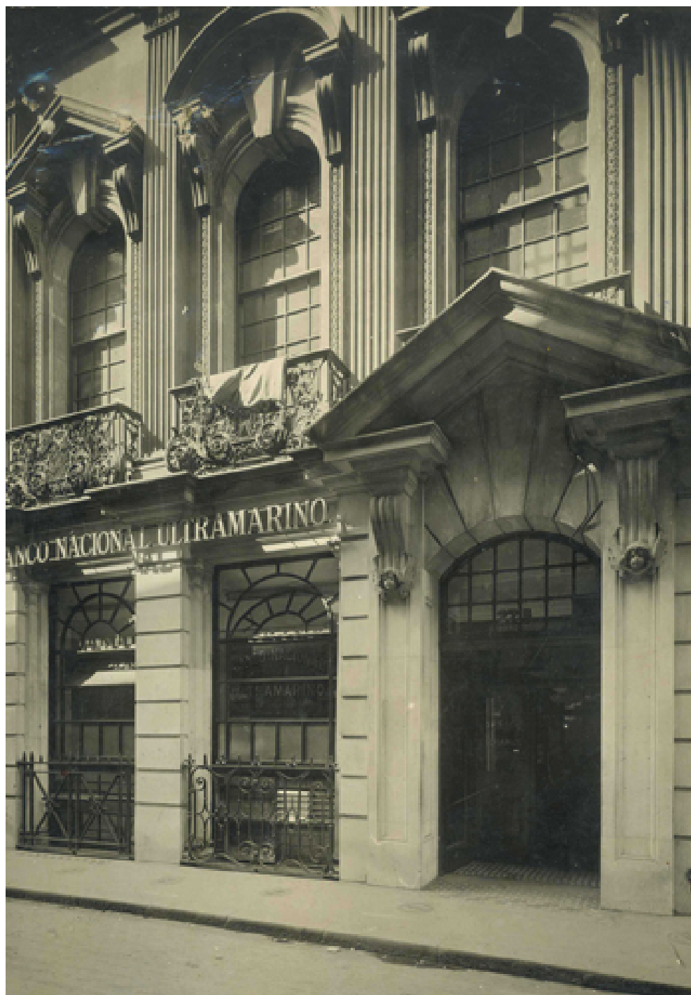
Agência em Londres