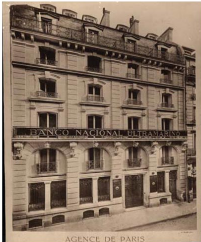
Agência de Paris. 1919. AFBNU. PT/CGD/BNU/AF/02AG/05.01