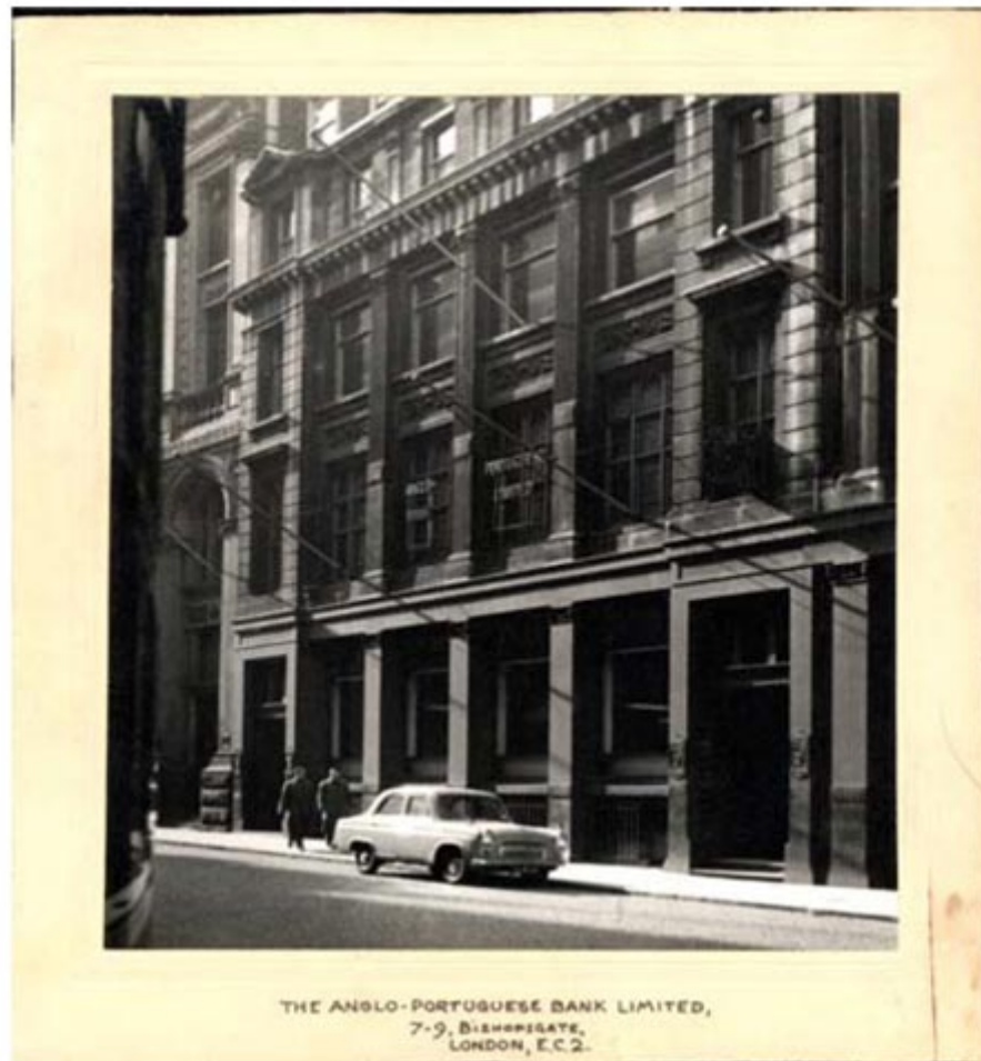
Anglo-Portuguese Bank (alteração da denominação em 1955).1955. AFBNU. PT/CGD/BNU/AF/05BA/01.01