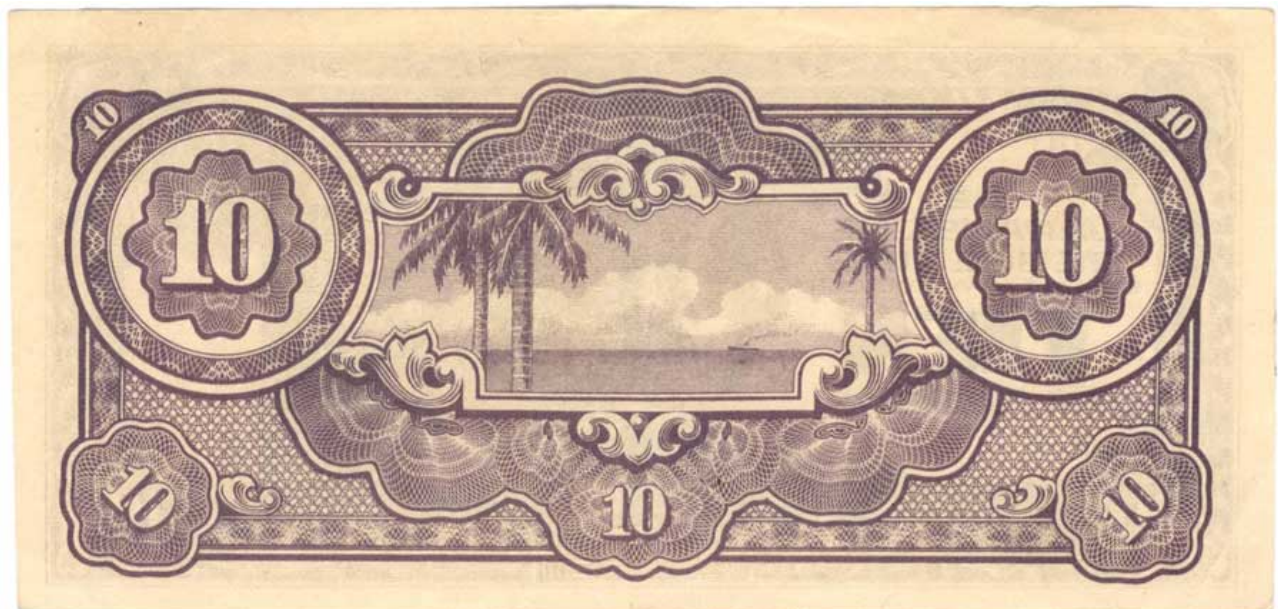
Verso Nota 10 Gulden do Governo Japonês (1941-45)