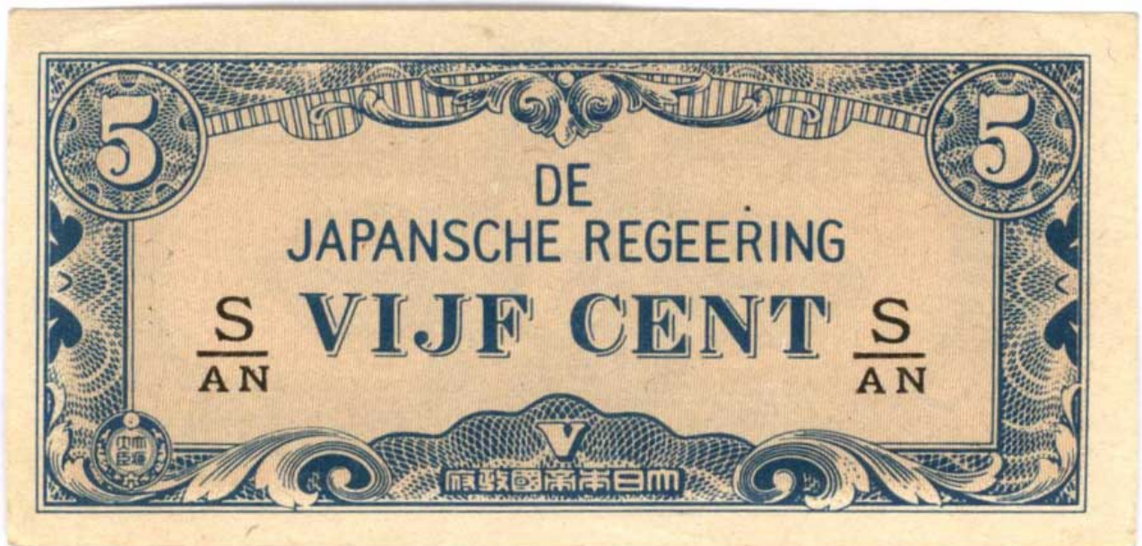
Cédula 5 Cent do Governo Japonês (1941-45)