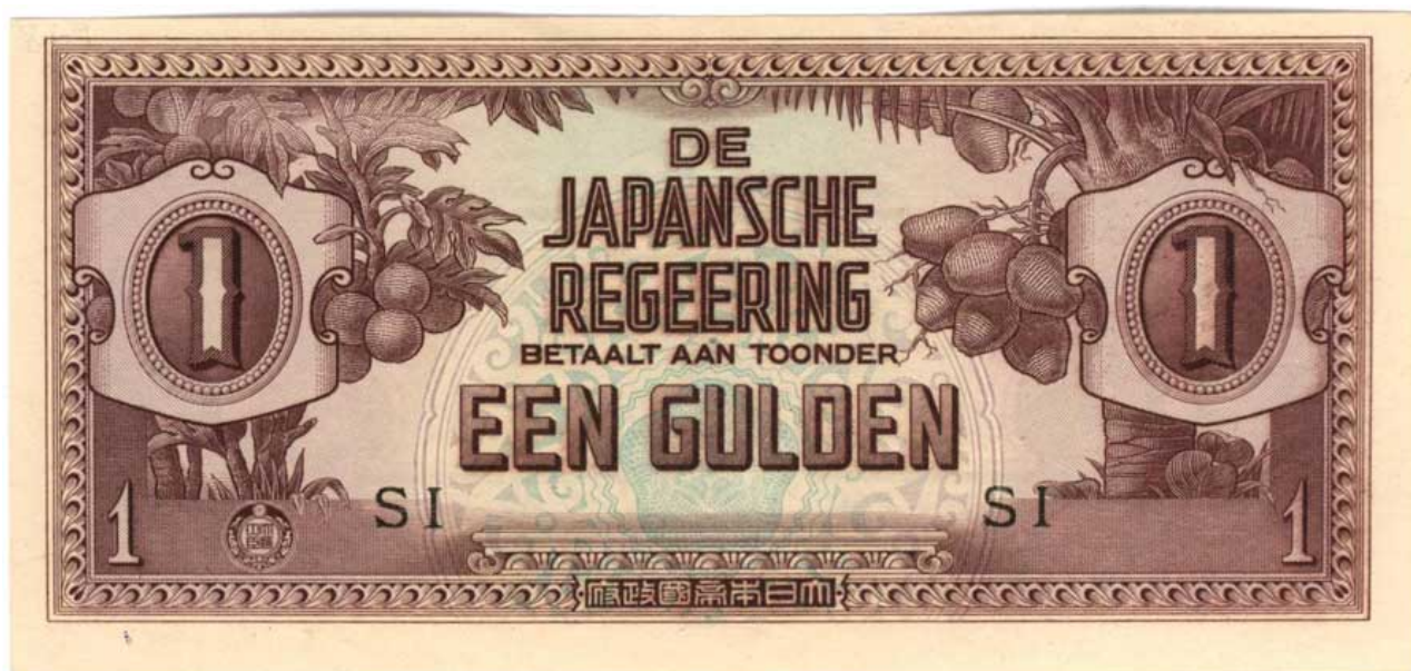
Nota 1 Gulden do Governo Japonês (1941-45)