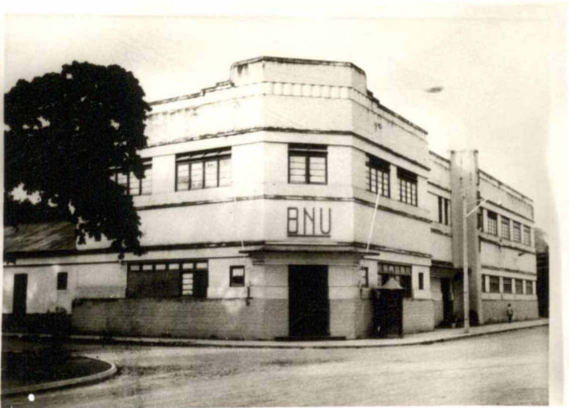
Filial do BNU em Díli instalada após a II Guerra Mundial num edifício da SAPT