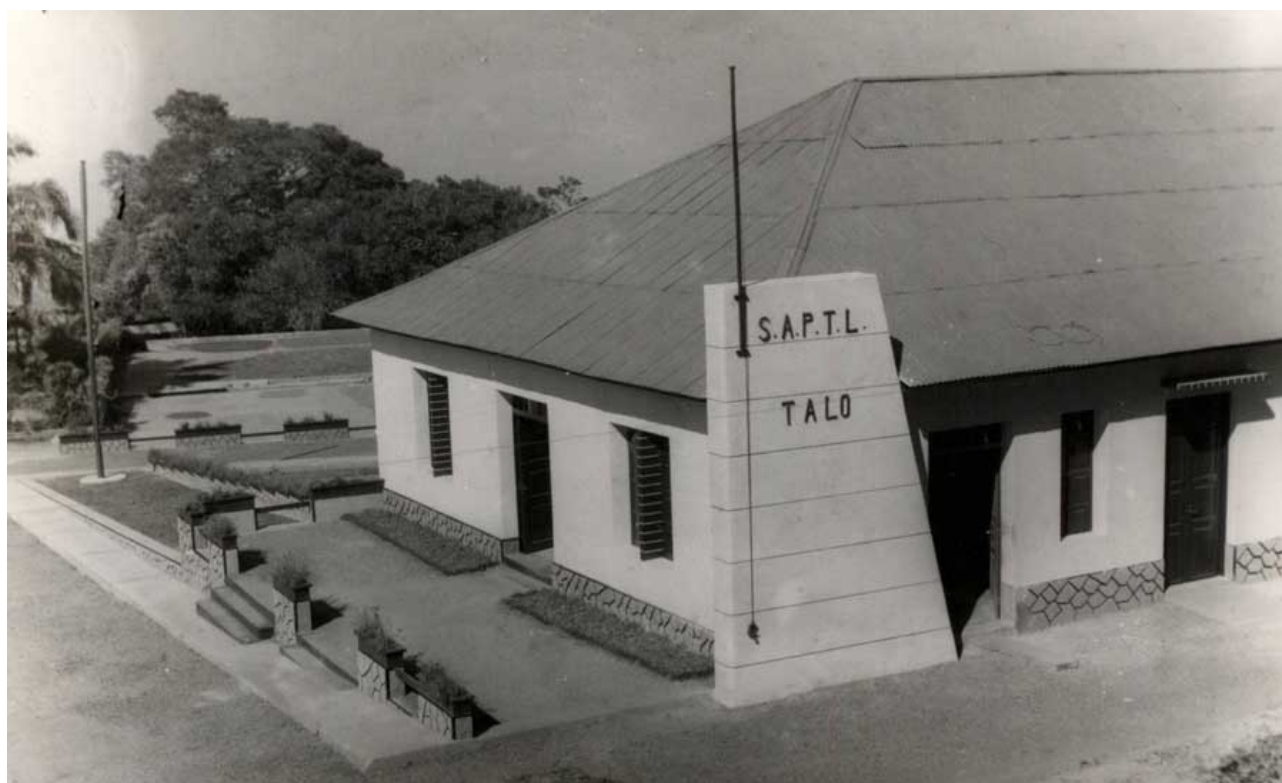
Edifício SAPT - Escritório e Cantina (1956)