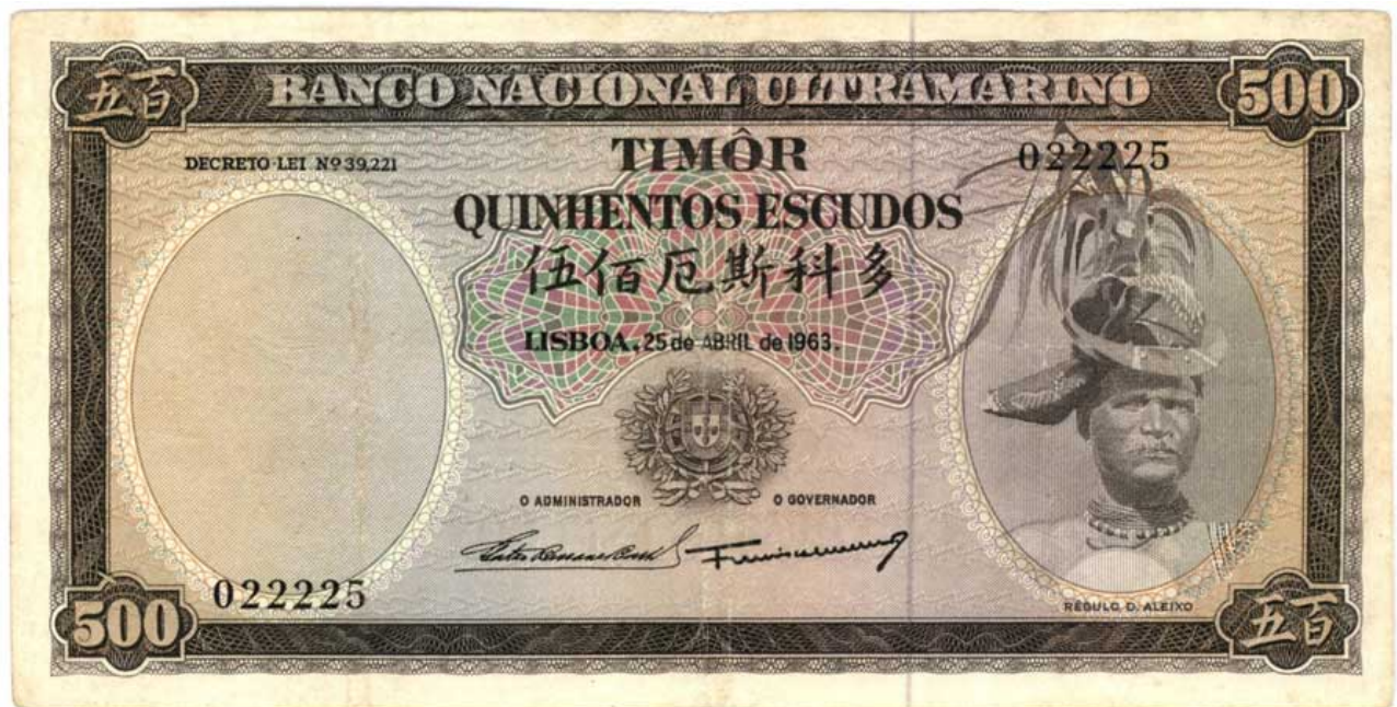
Nota 500 escudos da Emissão Régulo D Aleixo de 1963