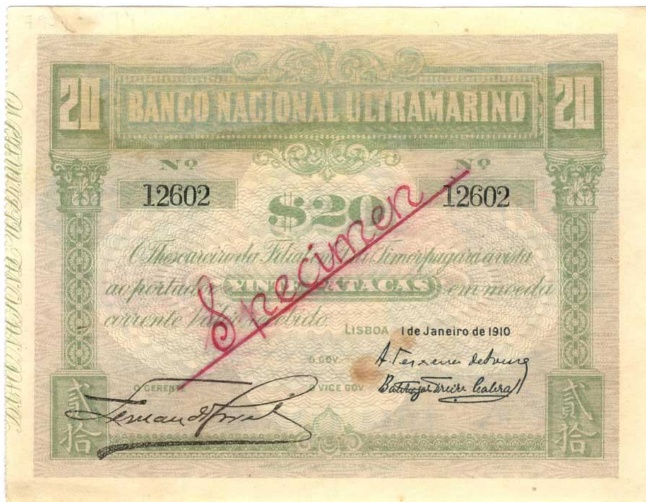
Espécime de Nota 20 Patacas da Emissão Antiga-Simples para BNU Timor (1915)