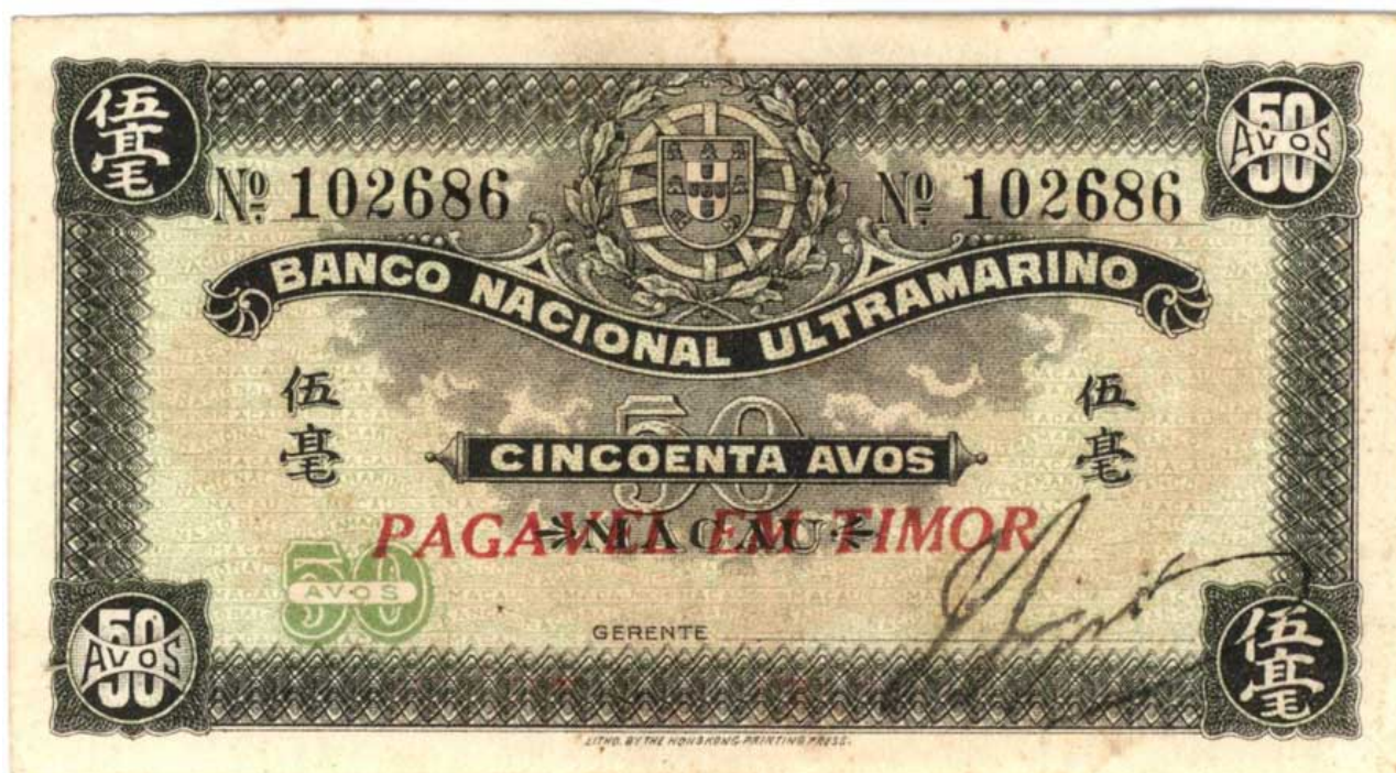
Cédula 50 avos com sobrecarga para circular em Timor e assinatura do gerente J.J.Duarte (1940)